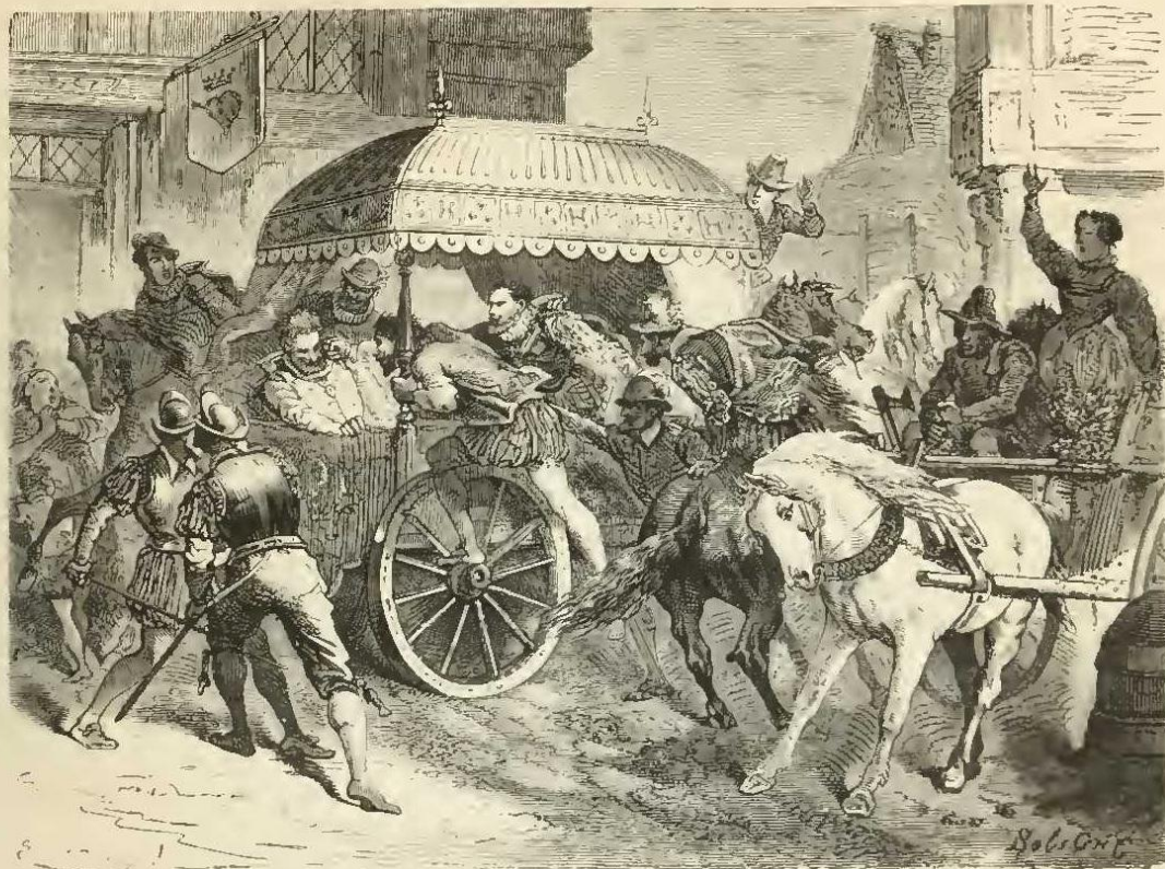
Assassinat d'Henri IV.

mençaient dans quelques-unes des chaires de Paris.